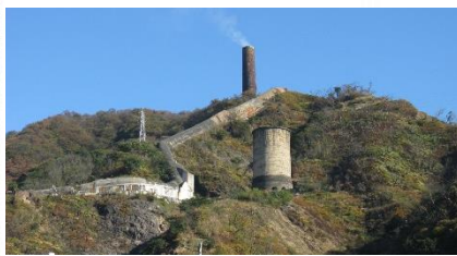
5億年前のカンブリア紀の地層を観察。日本の近代産業を育んだ日立鉱山