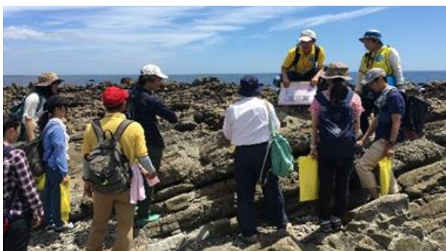
アンモナイトが暮らした8000万年前の白亜紀の地層が観察できる平磯海岸